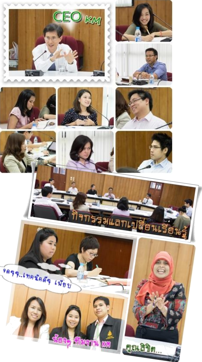
KM การเรียนการสอน ๒๕๕๕ คณะนิติศาสตร์ ม.รามคำแหง