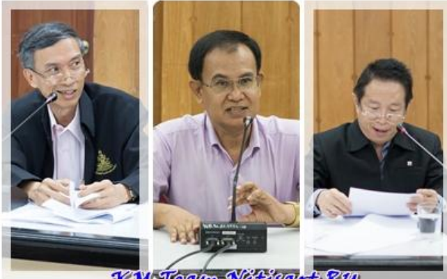
KM Team Nitisart RU