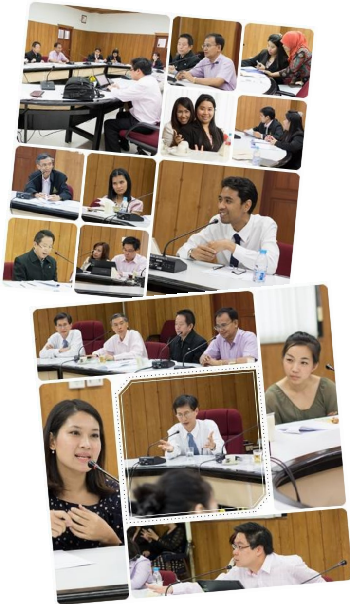
กิจกรรมแลกเปลี่ยนเรียนรู้ “ประสบการณ์ดี ๆ จากพี่น้อง”